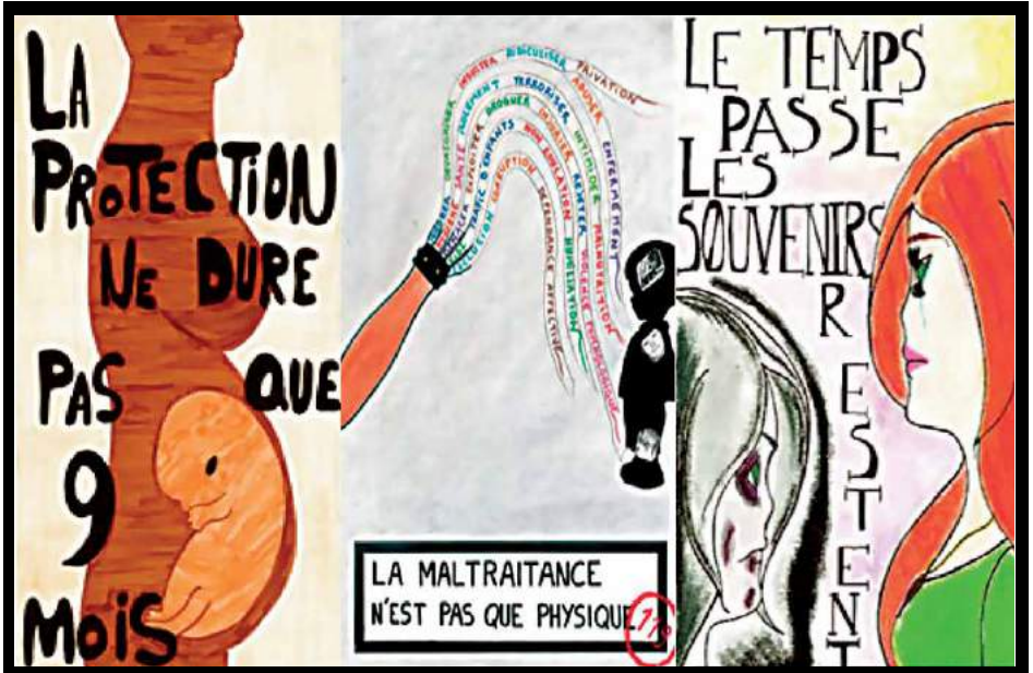
Concours d'affiches "agis pour tes droits" Francas

TOUT CE QUI FAIT SOUFFRIR EST UNE VIOLENCE !